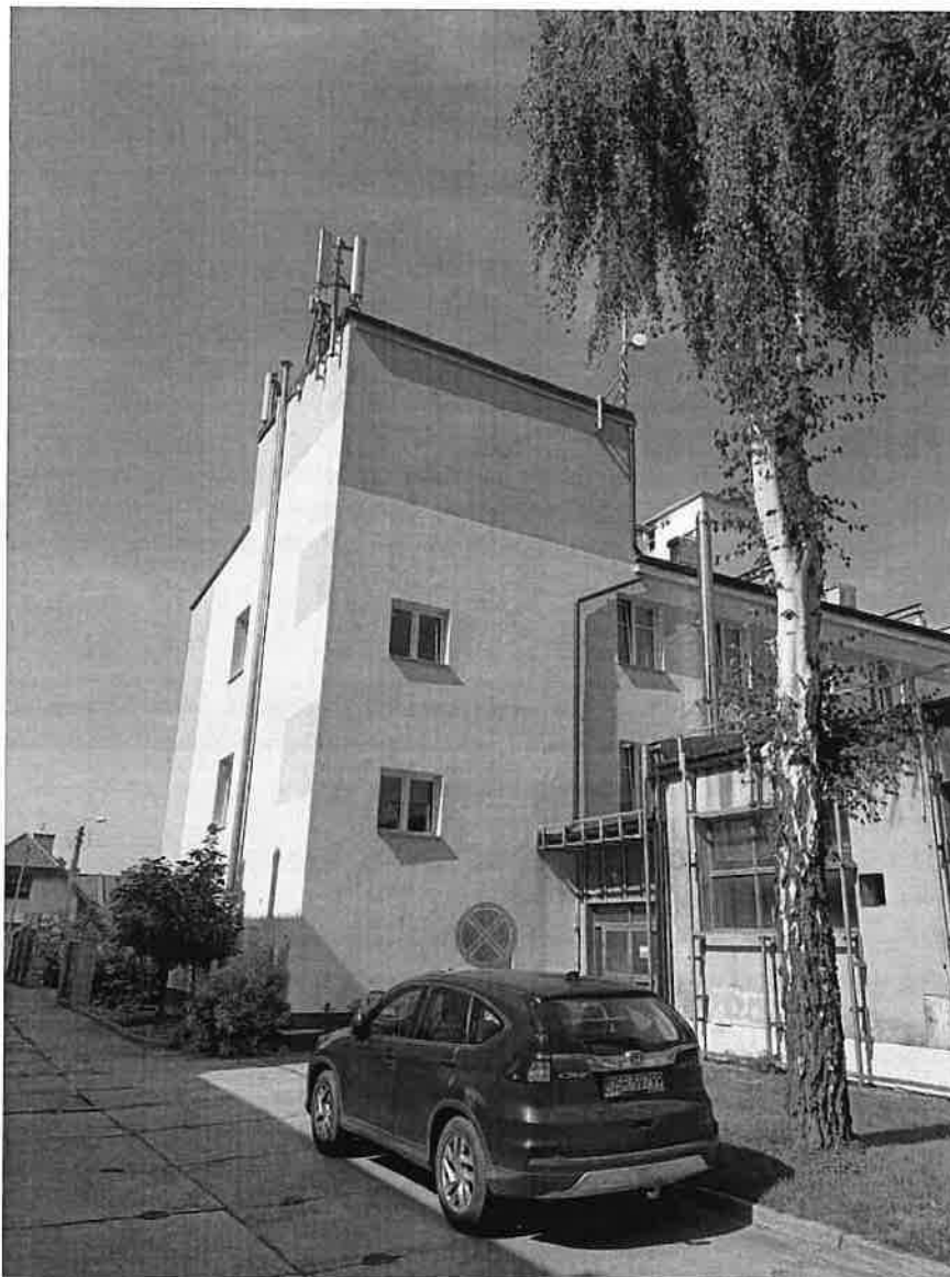
Zdjęcie 1 Badany obiekt