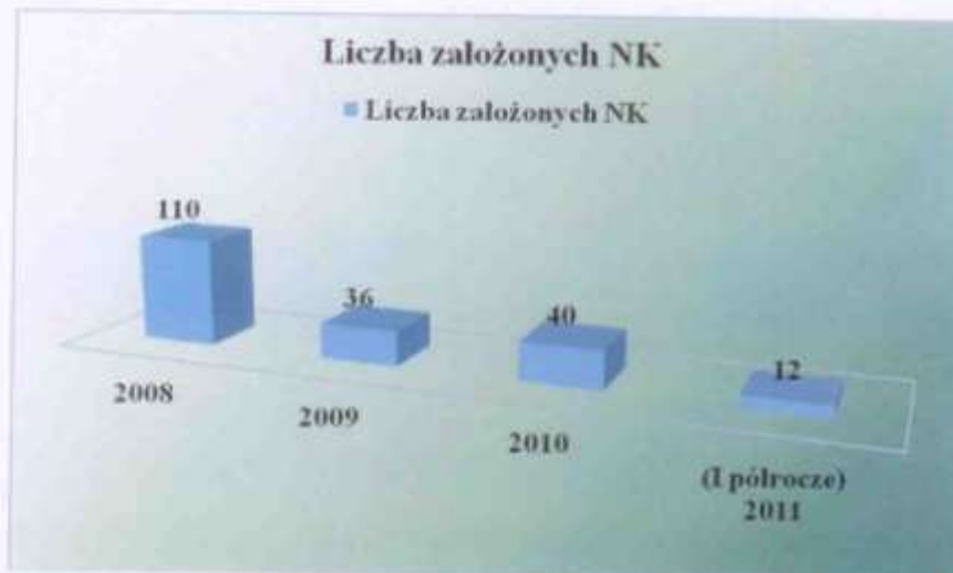
Wykres 3. Liczba założonych Niebieskich Kart w latach 2008 – 2011 (I półrocze).

Powyższe dane na temat przemocy w rodzinie nie przedstawiają całego obrazu występującego zjawiska. Powodem tego jest zbyt mały przepływ informacji między instytucjami zajmującymi się problemem przemocy w rodzinie oraz brak jednolitego rejestru przypadków przemocy domowej. Ponadto nadal się zdarza, że wiele przypadków przemocy w rodzinie nie jest zgłaszanych np. ze wstydu lub biernej postawy świadków przemocy.