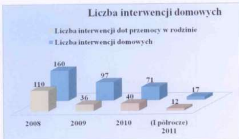
Wykres 1. Liczba przeprowadzonych interwencji policji w latach 2008 – 2011 (I półrocze).

Dane na podstawie przeprowadzonych interwencji domowych przez Komendę Powiatową Policji w Środzie Śląskiej w latach 2008 – 2011 (I półrocze).